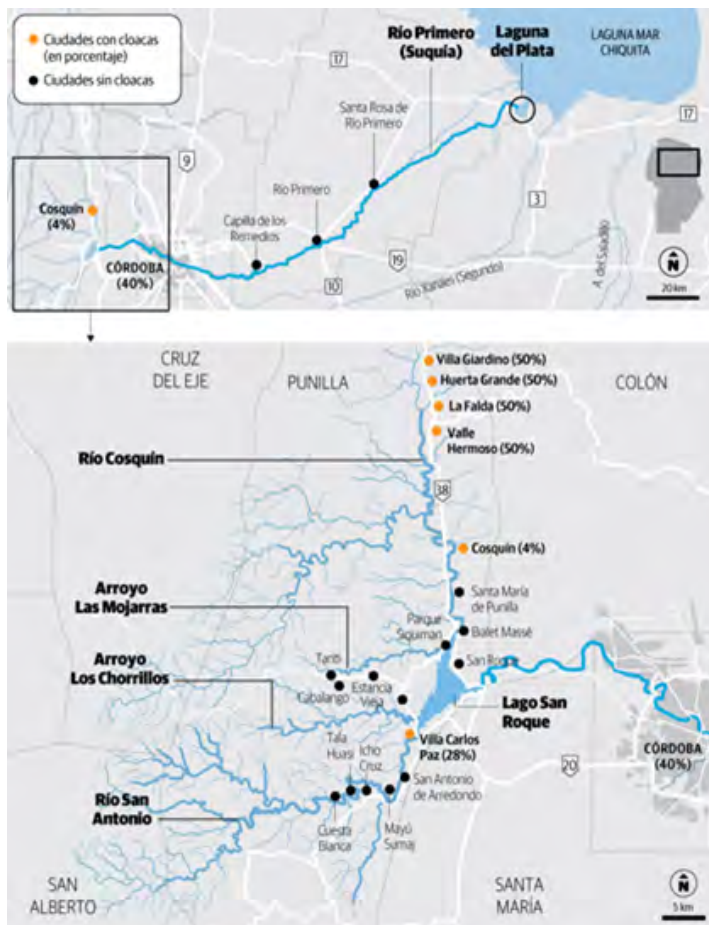
Mapa de cuenca del Lago San Roque.

El Embalse San Roque está situado aproximadamente a 600 msnm (metros sobre el nivel del mar) en el Valle de Punilla, en la alta cuenca del Río Suquía. Su área de drenaje comprende una superficie de 1750 km 2 , recibiendo el aporte de cuatro tributarios. Los ríos San Antonio y Cosquín junto con los arroyos Los Chorrillos y Las Mojarras, sumados al pequeño aporte debido al perillago (área circundante al lago), conforman las fuentes de agua por escorrentía superficial del referido embalse. A su vez, cuenta con un único efluente, el Río Suquía (Bustamante et al. , 2002).