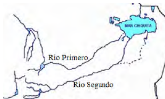
Recorrido de los Ríos Primero (Suquía) y Segundo (Xanaes)

provenientes de la actividad agrícola, industrial y los arrojados por las zonas más pobladas 34 . A su vez, este río junto con el Suquía y el Dulce, tributa en la laguna Mar Chiquita o Ansenusa, la cual se ve afectada por toda la contaminación acumulada.