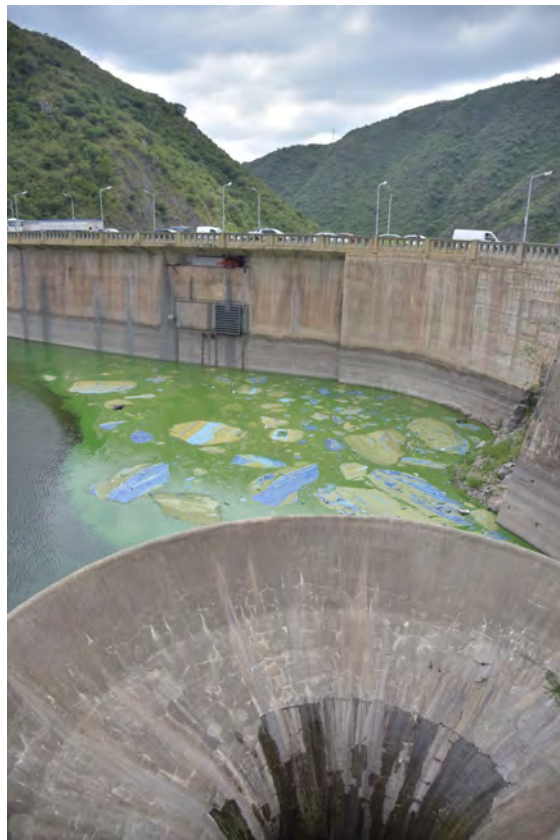
Imagen del Lago San Roque del mes de enero de 2018.

El lago San Roque naturalmente posee un estado natural eutrófico, es decir una proliferación desmedida de algas, generando como consecuencia una coloración verdosa visible desde la superficie, mal olor y posible presencia de toxinas (Agüero, 2018).